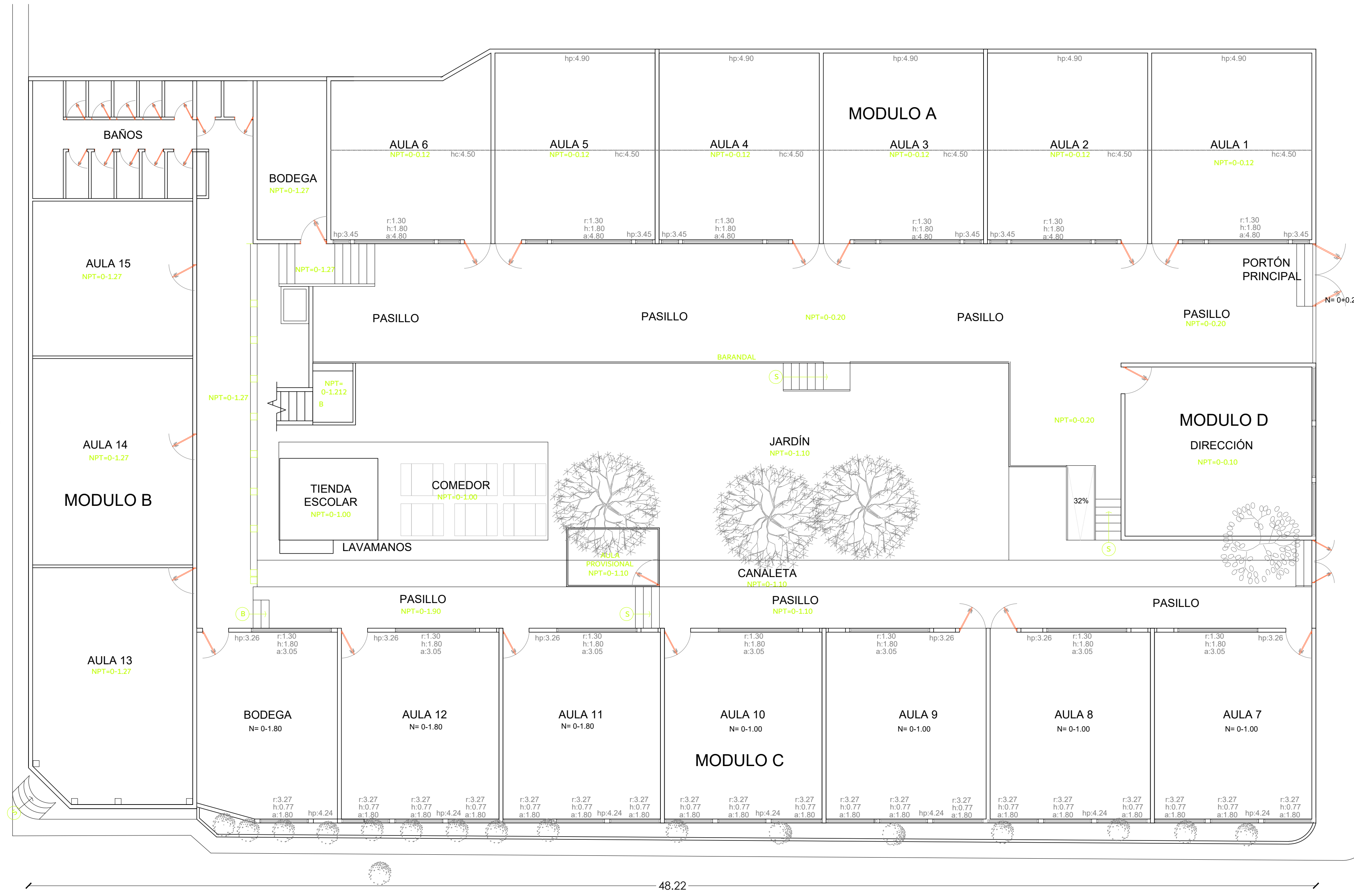
PLANTA DE SITUACIÓN ACTUAL 1ER NIVEL DISTRIBUCIÓN ACTUAL ESCALA 1: 100